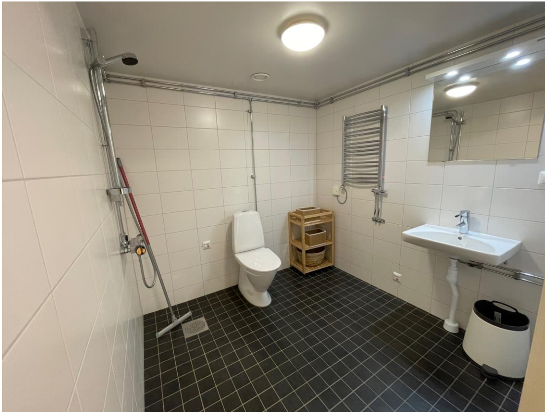
Figur 5 Rymlig toalett med dusch och handfat.