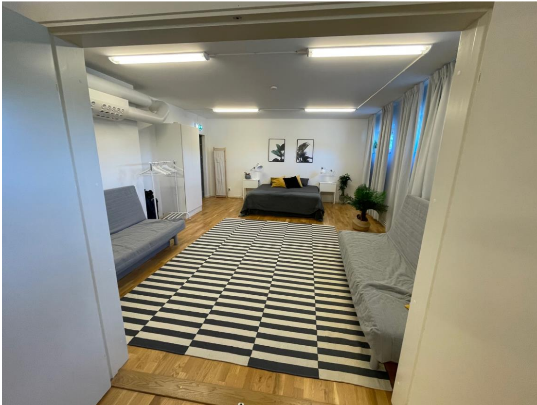
Figur 7 Sovrum med dubbelsäng, två bäddsoffor och garderober.