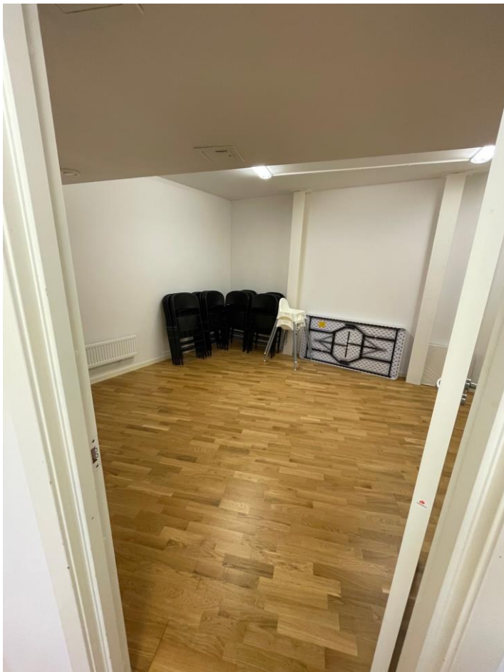
Figur 6 Förrådsrum med stolar, bord och barnstol etc.