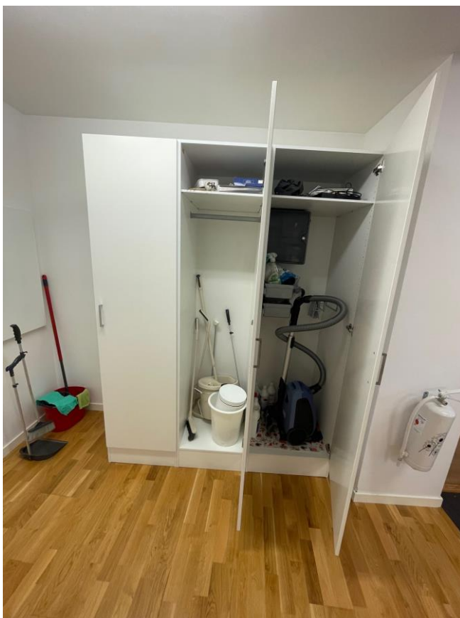
Figur 4 Garderob med städutrustning samt brandsläckare.