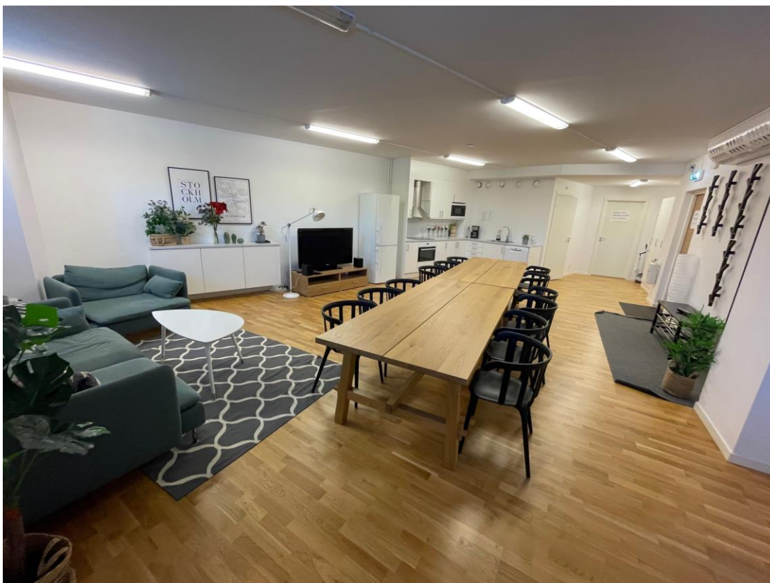
Figur 2 Vardagsrum med stort bord plats för 12 personer samt soffgrupp till vänster.