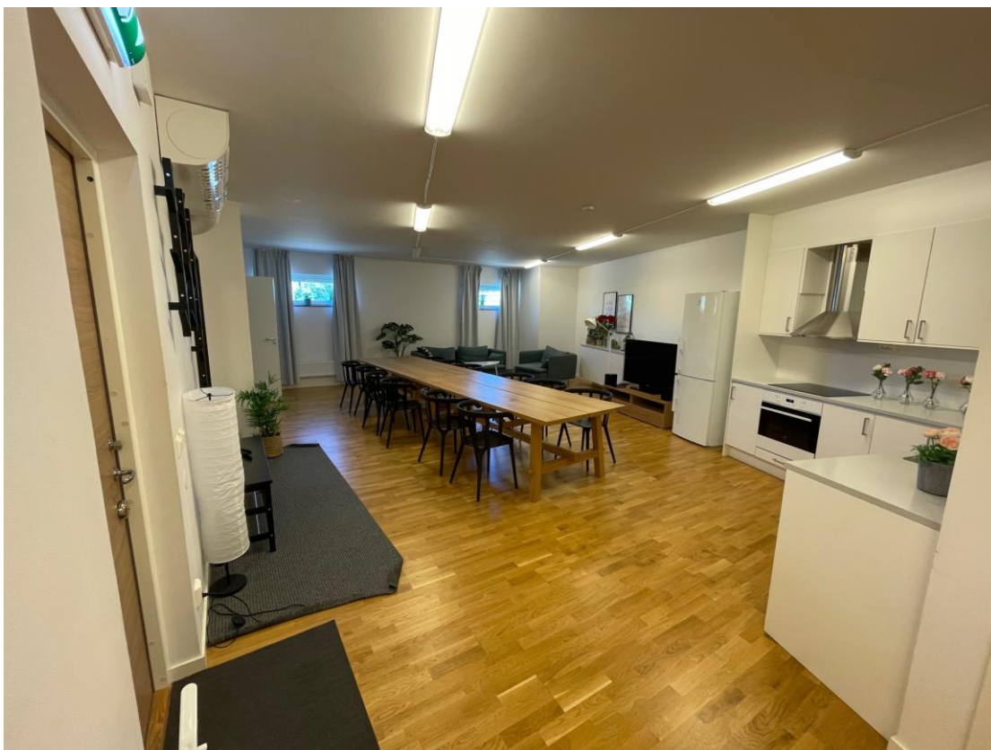
Figur 1 Vardagsrum med ingång från vänster och kök till höger.