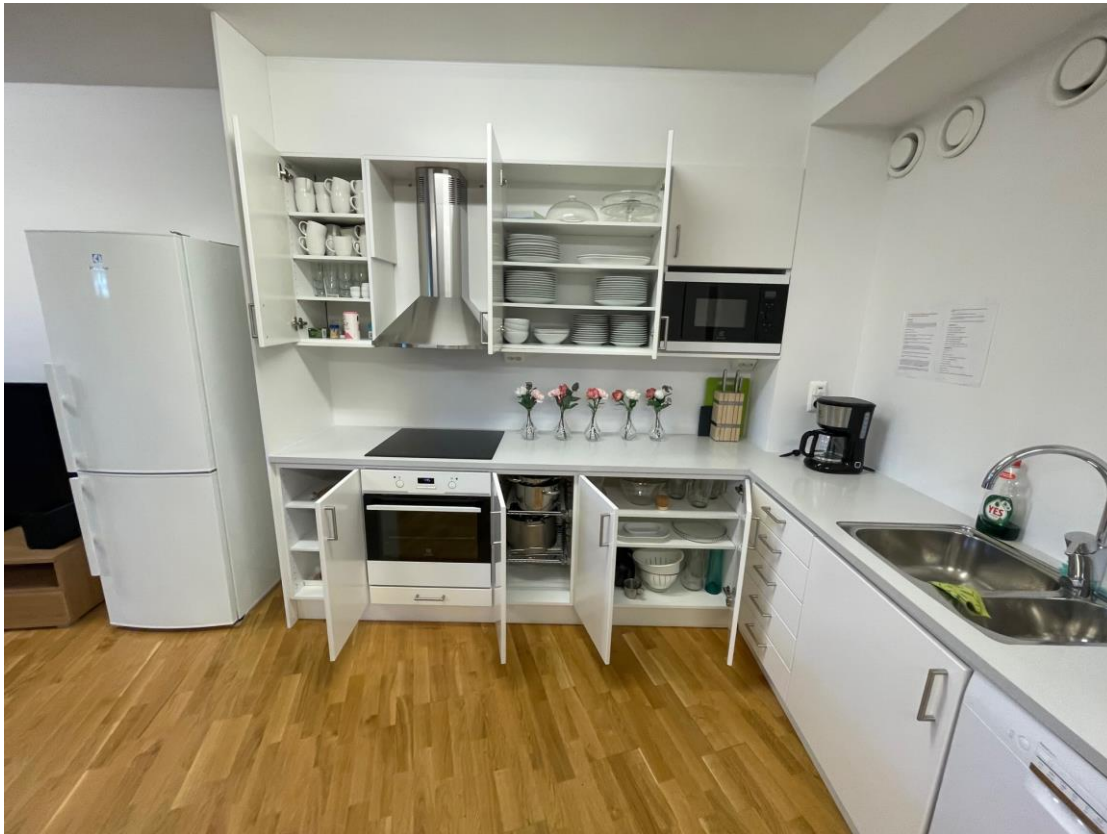
Figur 3 Kök med kylskåp, ugn, spis, micro, kaffebryggare, diskmaskin och tillhörande köksservis.